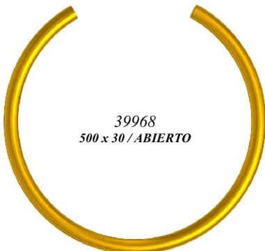
39968 500 x 30 / ABIERTO