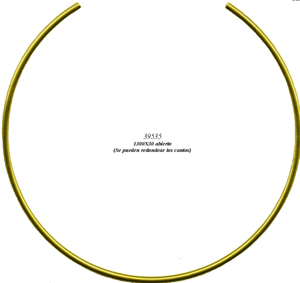
39535 1300X30 abierto (Se pueden redondear los cantos)