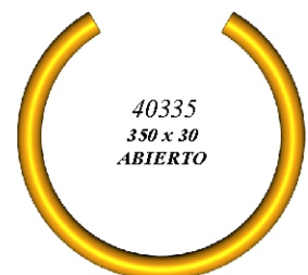
40335 350 x 30 ABIERTO