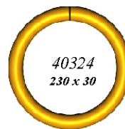
40324 230 x 30